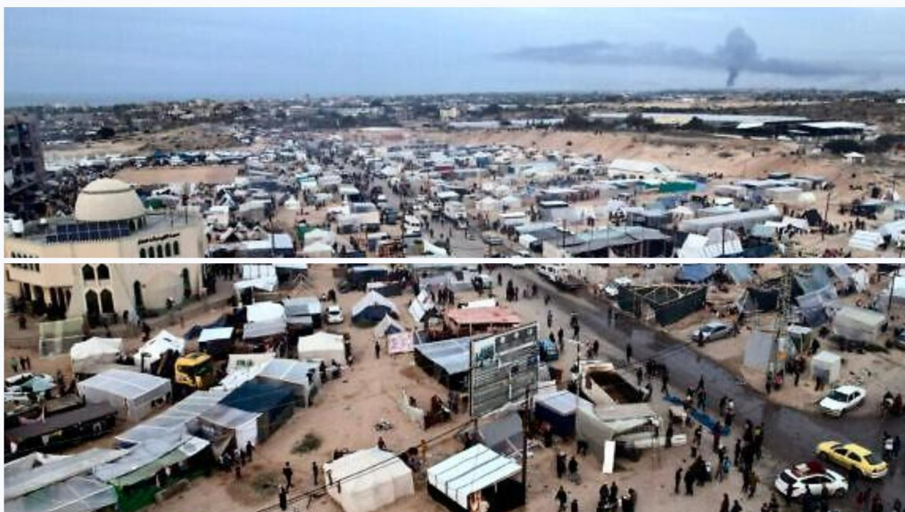
Rafah - février 2024

Une fois les histoires sélectionnées, nous assurons leur développement et les moyens de les réaliser.