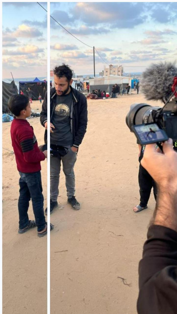
Un des cinéastes en repérage

Puis ces coordinateurs assurent le transfert des données pour la post-production. Nous avons déjà fait des tests. Les transferts sont parfois longs mais ils réussissent.