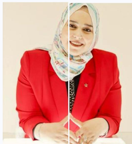
Une des cinéastes.