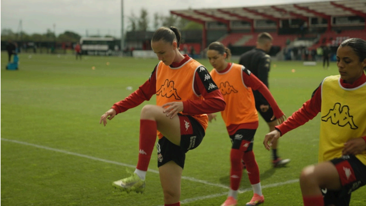
Photogrammes tirés du film