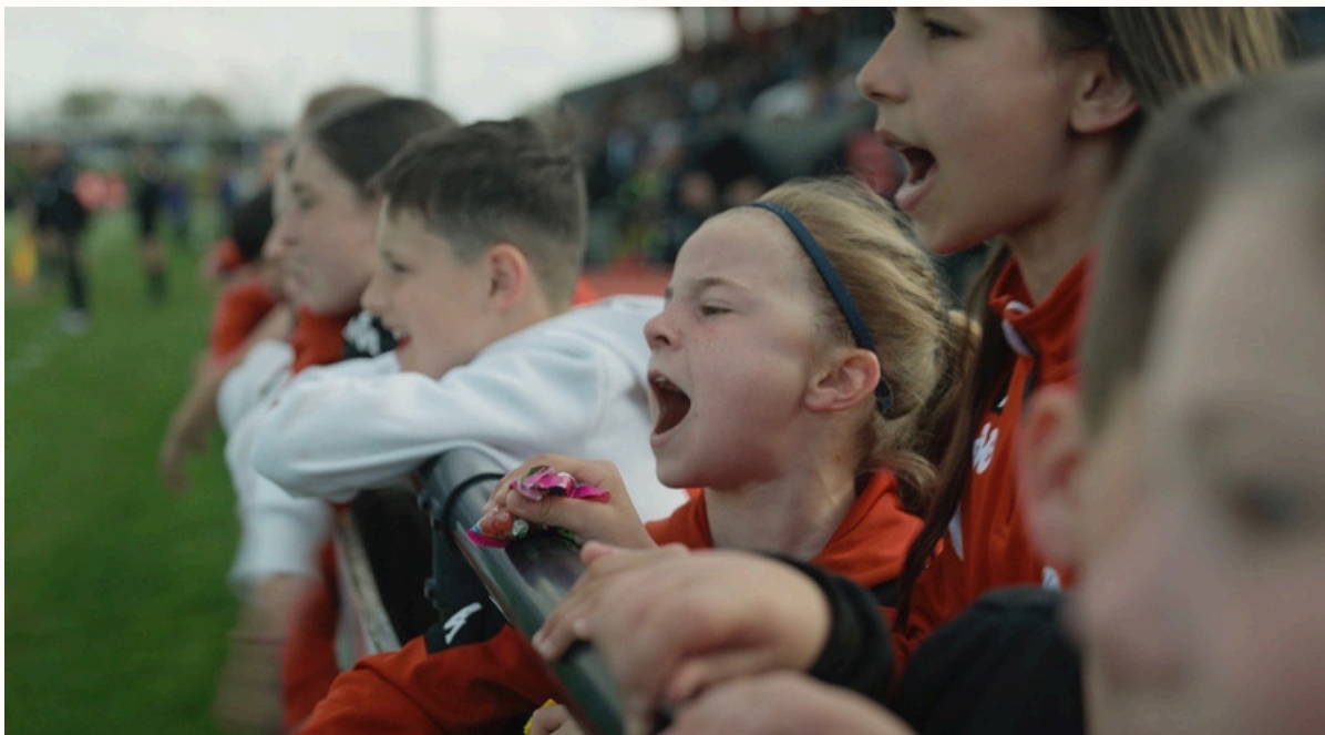
Photogrammes tirés du film