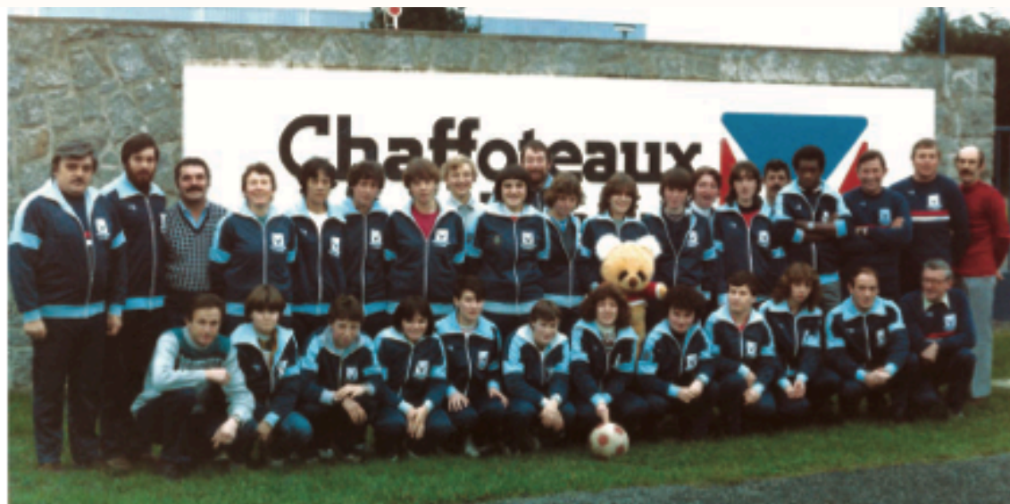
Une des générations de Chaffoteaux. Soudées et pleines d'énergie, ces femmes ont vécu une incroyable aventure sur deux décennies.