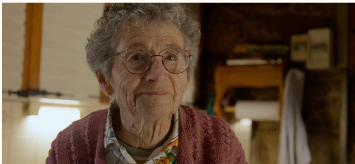
Madame Lulu (2022)